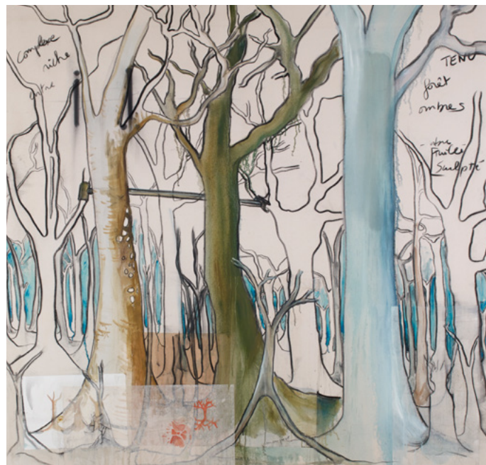
Fabrice Hyber, Tenu , 2005. Collection privée, Paris. © Fabrice Hyber.

Rendant à l'arbre la place que l'anthropocentrisme lui avait soustraite, Nous les Arbres réunit les témoignages, artistiques ou scientifiques, de ceux qui portent sur le monde végétal un regard émerveillé et qui nous révèlent que, selon la formule du philosophe Emanuele Coccia , « il n'y a rien de purement humain, il y a du végétal dans tout ce qui est humain, il y a de l'arbre à l'origine de toute expérience ».