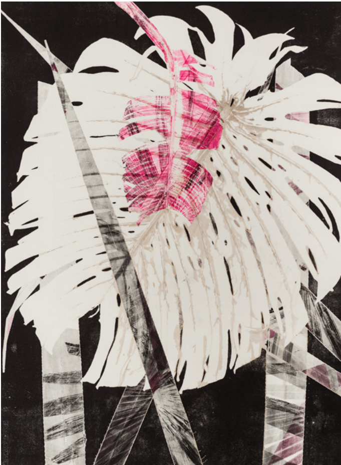
Luiz Zerbini, Philodendron Vermelho I , 2018. Collection de l'artiste, Rio de Janeiro, Brésil. © Luiz Zerbini.

Rythmé par plusieurs corpus de dessins, peintures, photographies, films et installations d'artistes d'Amérique latine, d'Europe, des États-Unis, mais également d'Iran, ou encore de communautés indigènes comme les Nivaklé et Guaraní du Gran Chaco, au Paraguay, ainsi que les Indiens Yanomami qui vivent au cœur de la forêt amazonienne, le parcours de l'exposition déroule trois fils narratifs : la connaissance des arbres – de la botanique à la nouvelle biologie végétale – ; leur esthétique – de la contemplation naturaliste à la transposition onirique – ; leur dévastation – du constat documentaire au témoignage artistique.