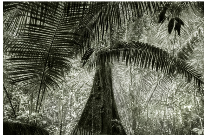
Cássio Vasconcellos, A Picturesque Voyage Through Brazil #28 , 2015. Collection de l'artiste, São Paulo, Brésil.

RESPONSABLE DES RELATIONS PRESSE Matthieu Simonnet matthieu.simonnet@fondation.cartier.com Tél. 01 42 18 56 77