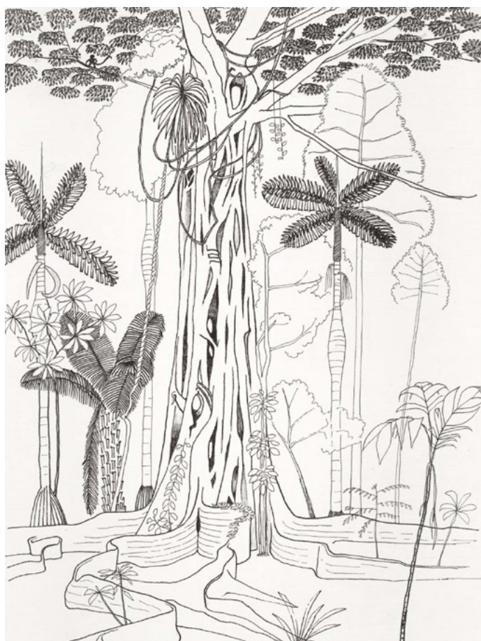
Francis Hallé, Figuier étrangleur , Rio Maru, Amazonie péruvienne, 2012. © Francis Hallé.

Réunissant une communauté d'artistes, de botanistes et de philosophes, la Fondation Cartier pour l'art contemporain se fait l'écho des plus récentes recherches scientifiques qui portent sur les arbres un regard renouvelé. Nous les Arbres s'organise autour de plusieurs grands ensembles d'œuvres et laisse entendre la voix de ceux qui ont tissé, à travers leur parcours esthétique ou scientifique, un lien fort et intime avec les arbres. L'exposition est l'occasion de mettre en lumière la beauté et la richesse biologique de ces remarquables protagonistes du monde vivant, aujourd'hui massivement menacés.