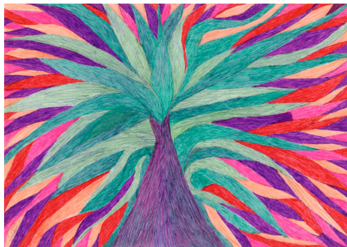
Salim Karami, Sans titre , 2009. Courtesy de la Galerie Polysémie, Marseille, France. © Salim Karami.

Après avoir été longtemps sous-évalués par la biologie, les arbres – comme l'ensemble du règne végétal – ont fait l'objet, ces dernières décennies, de découvertes scientifiques qui permettent de porter un nouveau regard sur les plus anciens membres de la communauté des vivants*. Capacités sensorielles, aptitude à la communication, développement d'une mémoire, symbiose avec d'autres espèces et influence climatique ; la révélation de ces facultés invite à émettre l'hypothèse fascinante d'une « intelligence végétale » qui pourrait apporter des éléments de réponse à bien des défis environnementaux actuels. En résonance avec cette « révolution végétale », l'exposition Nous les Arbres croise les réflexions d'artistes et de chercheurs, prolongeant ainsi l'exploration des questions écologiques et de la relation de l'homme à la nature, récurrente dans la programmation de la Fondation Cartier, comme ce fut le cas récemment avec Le Grand Orchestre des Animaux (2016).