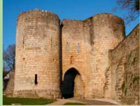
Porte de Soissons

Évoquant l'architecture militaire du XIII e siècle, elle est flanquée de deux grosses tours avec archères et comprenait deux salles de gardes voûtées. À côté, la Tour penchée de Dame Eve glissa sur son pivot dès le XII e siècle.