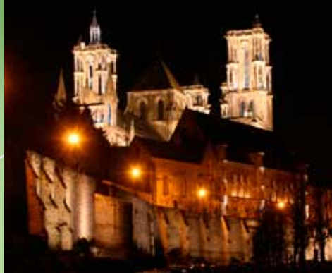
Cathédrale Notre-Dame de Laon et Palais Episcopal

Cette cour était celle d'une hostellerie où l'on raconte que Louis XIII et Anne d'Autriche conçurent Louis XIV en revenant d'un pèlerinage à Liesse.