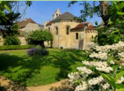
Chapelle des Templiers

Dans l'ancienne commanderie, se dresse la chapelle des Templiers bâtie vers 1140 sur le modèle du Saint-Sépulcre de Jérusalem. Joutant la chapelle, le musée recèle, dans ses riches collections «le Concert» des frères Le Nain (XVII e siècle), originaires de Laon.