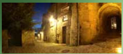
Porte des Chenizelles

Refuge de l'abbaye du même nom située hors les murs de la ville, servait d'hospice aux pèlerins et de refuge aux religieux lors des invasions.