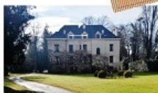
LE CHATEAU "LACROIX"