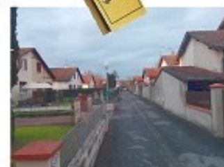
LA CITÉ OUVRIÈRE