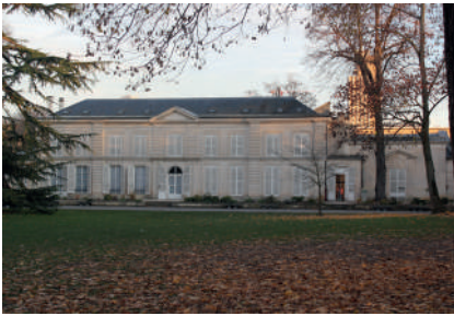
La maison Raspail, façade Ouest

une annonce de mise en vente en 1800 4 , et qu'il est tout à fait exclu qu'elle ait été construite durant la décennie révolutionnaire, il est au moins assuré qu'elle date d'avant la Révolution française.