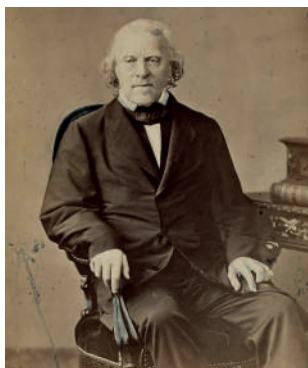
FV Raspail, photo 1862, bdef

Tout pris en compte, l'occupation des lieux est à la fois faible, hétérogène, restreinte, plutôt réservée aux services de la Ville, et peu transparente pour le public. Les volets du bâtiment sont régulièrement fermés, alors même que le parc, le plus important de la commune, est très fréquenté. De plus, la maison ne pourrait être accessible que pendant l'ouverture du parc, qui ferme avec l'arrivée de la nuit, ce qui constitue des contraintes horaires dommageables pour imaginer faire vivre ce lieu.