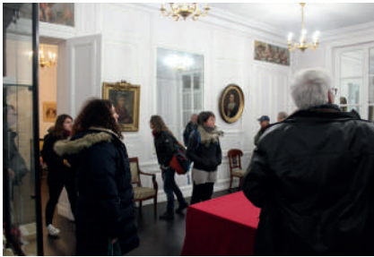
Musée Raspail, colloque 2022

toute leur vie pour la démocratie politique et la justice sociale. C'est ainsi que Benjamin lègue l'ensemble de la propriété (maison, parc, meubles, œuvres d'art, livres et manuscrits) au Département de la Seine, à condition que la maison accueille un hospice pour personnes âgées nécessiteuses, à une époque où la Sécurité sociale n'existe pas, ainsi qu'un musée, lieu de mémoire sur François-Vincent Raspail et d'exposition de la collection d'œuvres d'art de la famille. Au XX e siècle, le legs a été partiellement honoré : l'hospice a effectivement existé entre 1900 et 1978, tandis qu'un « musée Raspail » a été établi dans l'ancien théâtre (aujourd'hui appelé salle de l'Orangerie), un bâtiment à quelques encablures situé dans l'enceinte du parc.