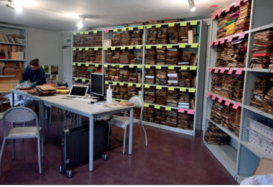
Le fonds d'archives Poulaille

et très rare en Europe. À la mort d'Henry Poulaille en 1980, la gestion de ce fonds a été prise en charge par l'Association des Amis d'Henry Poulaille. Une convention avec la Ville pour la conservation et la valorisation de ce fonds a été signée en 1995. En 2005, une convention de mise à disposition de locaux dans la